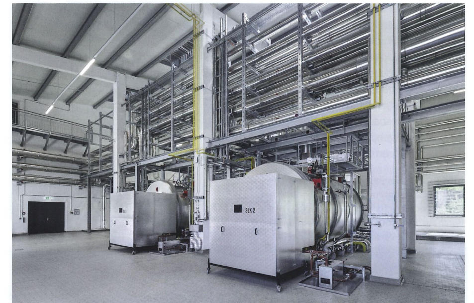
Zwei Satteldampfkessel mit Zweistoffbrennern (Öl/Gas) können bei Berchtesgadener Land mit jeweils 10 t/h den Spitzenlast-Dampfbedarf abdecken