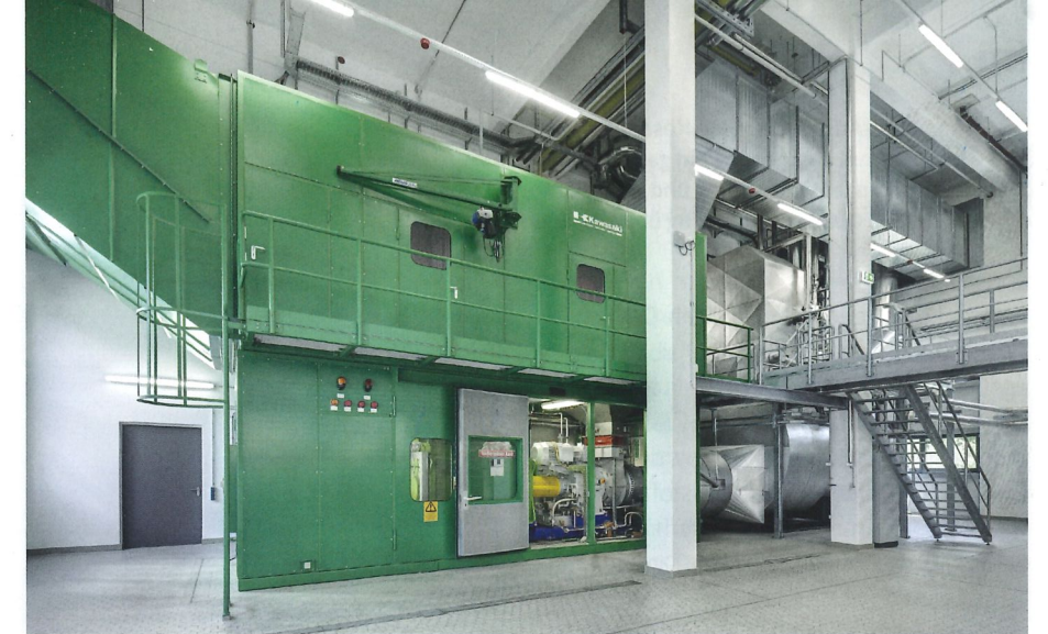
Eine hocheffektive Gasturbine – die auch mit Bio-Erdgas betrieben werden kann und H 2 -ready, also für Grünen Wasserstoff vorbereitet ist – versorgt die Produktion in Piding mit Dampf, Wärme und Strom.

Einer der Betriebe, der von Gammel planungstechnisch unterstützt wurde, sind die Milchwerke Berchtesgadener Land Chiemgau e.G.: An deren Molkerei in Piding entstand zwischen Oktober 2014 und Oktober 2016 eine komplett neue Energiezentrale auf dem bestehenden Betriebsgelände. Eine hocheffektive Gasturbine – die auch mit Bio-Erdgas betrieben werden kann und H 2 -ready, also für Grünen Wasserstoff vorbereitet ist – versorgt seither die Produktion mit Dampf, Wärme und Strom. Letzterer wurde zuvor aus dem öffentlichen Netz bezogen, die Wärme über klassische Gaskessel erzeugt. Bereits damals war eine erste Stufe der Produktionserweiterung beschlossen, weshalb das Gammel-Team um Projektleiter Thomas Winkler gleich ein zweistufiges Energiekonzept entwickelte. Nun stellt eine erdgasbefeuerte Gasturbine ca. 1,6 Megawatt (MW) als elektrische Grundlast bereit. Gleichzeitig wird die KWK-Wärme in einem