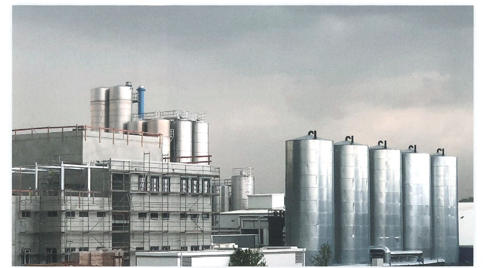
Zwischen 2015 und 2018 wurde der nördlichste Standort der genossenschaftlich organisierten Bayerischen Milchindustrie e.G. (BMI) im Sachsen-Anhaltinischen Jessen unter Beteiligung von Gammel Engineering grundlegend umgebaut und erweitert